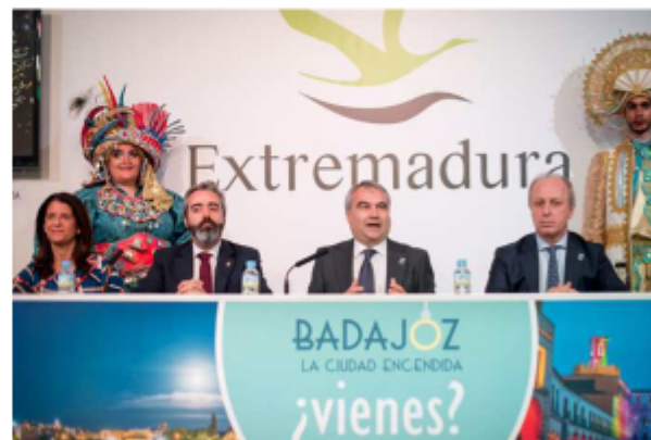
PRESENTACION EN FITUR