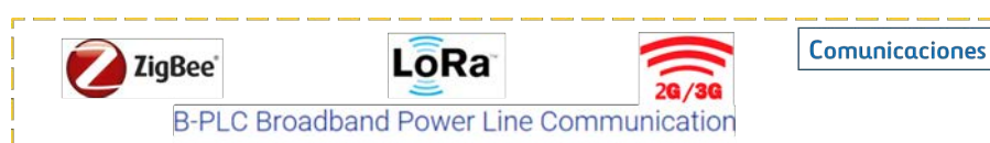
Ejemplo diferentes posibilidades de comunicación

El diseño de soluciones en un proyecto de este tipo se caracteriza por la gran cantidad de preguntas que se plantean y la importancia de la toma de decisiones. Las cuestiones a valorar son entre otras: que tipo de iluminación conectada se quiere plantear (punto a punto, control por salida, unidireccional, bidireccional...), si se plantea iluminación conectada en toda la ciudad o solo parte de ella, si utilizar la misma tecnología y fabricante para toda la solución diseñada, que comunicaciones utilizar, si priorizar OPEX frente a CAPEX o viceversa, si realizar la instalación fuera o dentro de la luminaria, etc.